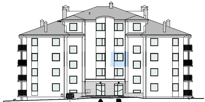
ELEWACJA PÓLNOCNNA - WEJŚCIOWA