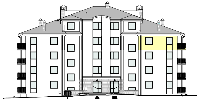
ELEWACJA PÓLNOCNNA - WEJŚCIOWA