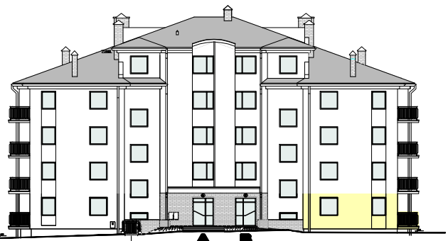
ELEWACJA PÓLNOCNNA - WEJŚCIOWA