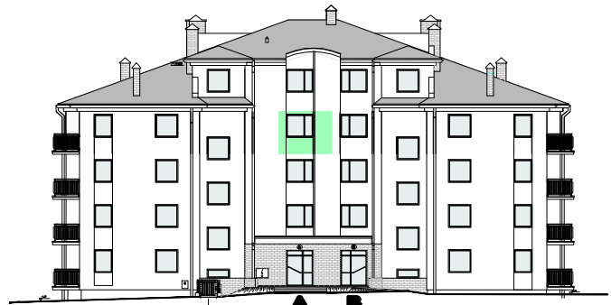
ELEWACJA PÓLNOCNNA - WEJŚCIOWA