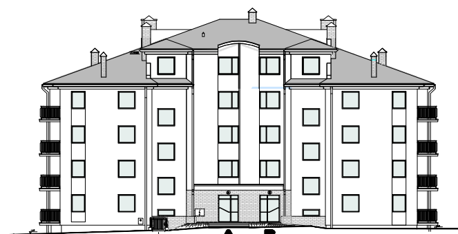
ELEWACJA PÓLNOCNNA - WEJŚCIOWA