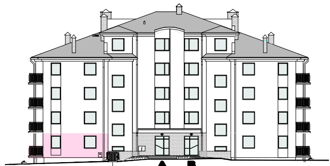
ELEWACJA PÓLNOCNNA - WEJŚCIOWA